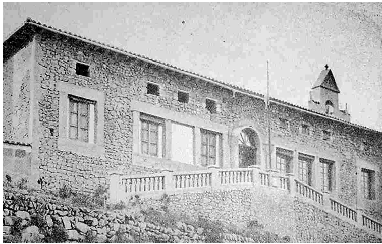
Escola i casal de colònies del Port de Sóller.