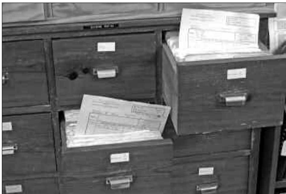
Vista parcial del fitxer de les parcel·les cadastrals de 1964.

Actualment, el negociat municipal de Rendes i Exaccions és l'encarregat de reflectir sobre els plànols les successives unificacions i parcel·lacions que es van produint, anotar les transmissions de propietat, actualitzar les dades i obrir noves fitxes.